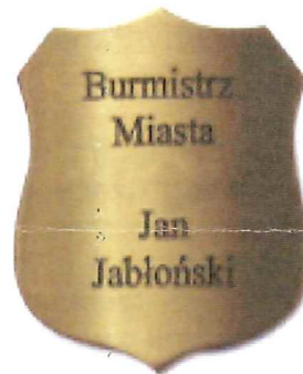
Przykład gwoździa fundacyjnego

Fundatorzy gwoździ otrzymają także dyplom honorowy. Na głowicy gwoździa w kształcie tarczy umieszczone będzie ręcznie grawerowane imię i nazwisko (lub nazwa) i miejscowość zamieszkania lub siedziby (ewentualnie sprawowana funkcja) fundatora. Gwoździe fundatorów umieszczane będą od góry drzewca sztandaru w kolejności od najwyższej darowizny. Wykaz fundatorów gwoździ opublikujemy też na naszych stronach internetowych oraz w prasie.